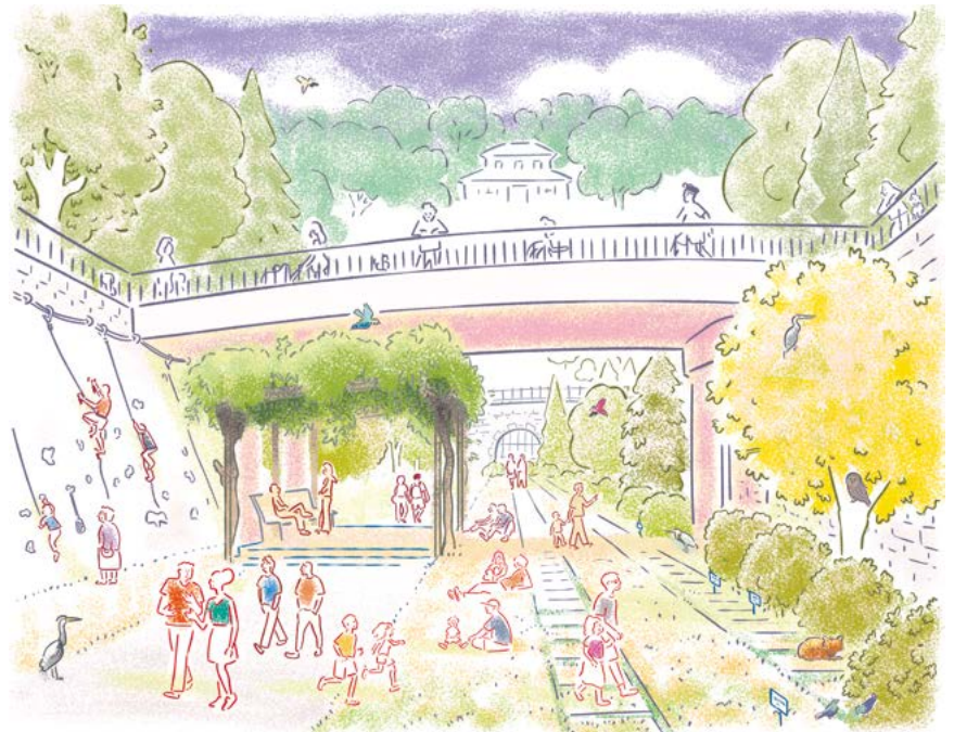
« La promenade sur la petite ceinture de demain » © Gabriel Gay.

Les 15 et 22 mars prochains, vous élirez un nouveau Maire pour donner un nouvel avenir à notre arrondissement.