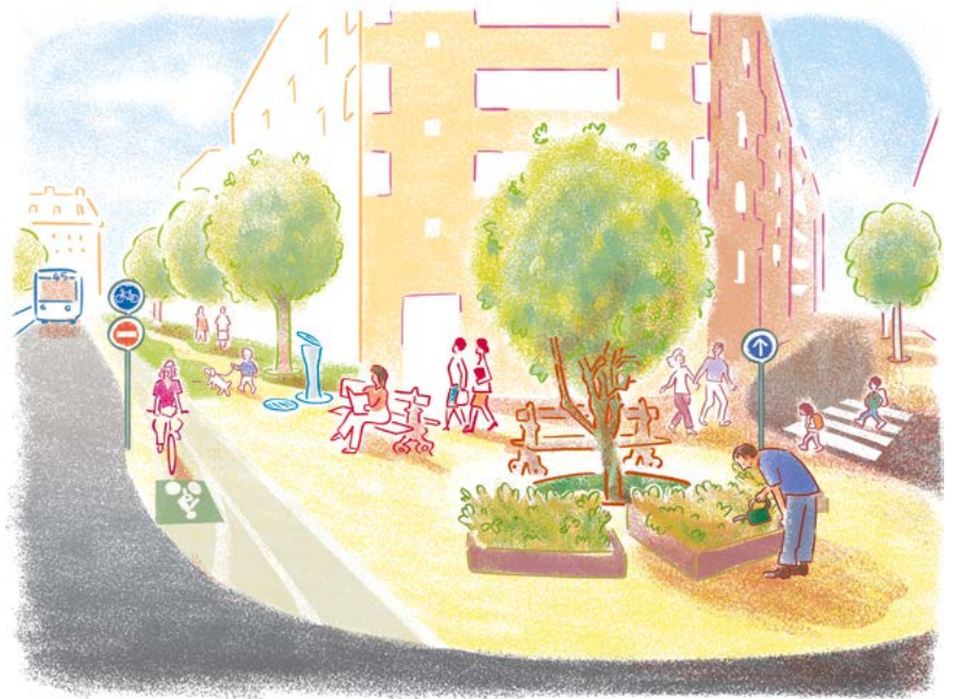
« La place du Maroc de demain » © Gabriel Gay.

Les 15 et 22 mars, donnons un nouveau souffle à notre quartier, votons pour un 19 e écologiste et solidaire.