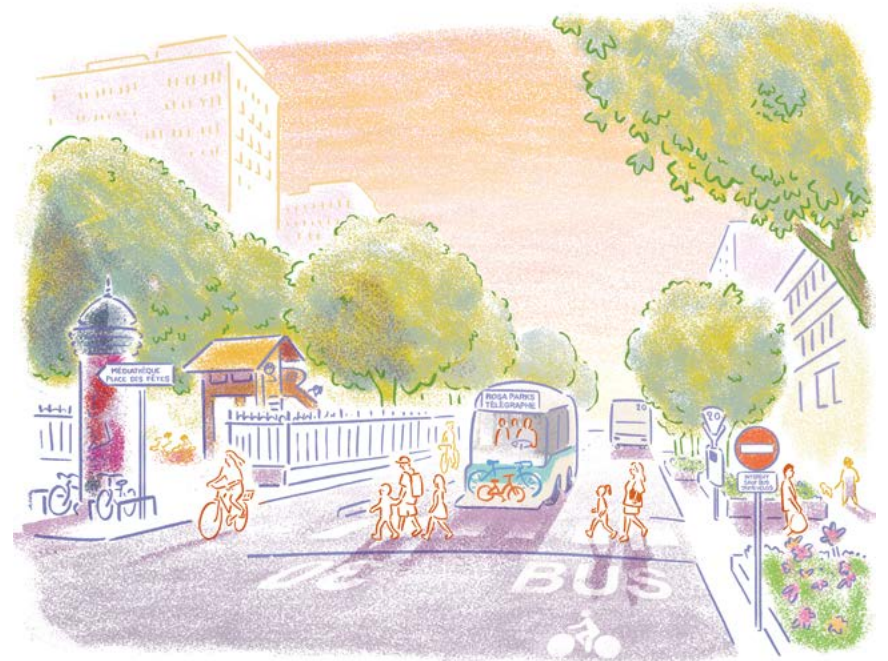
« Croisement rues de Belleville et Compans »

Les 15 et 22 mars, donnons un nouveau souffle à notre quartier, votons pour un 19 e écologiste et solidaire.